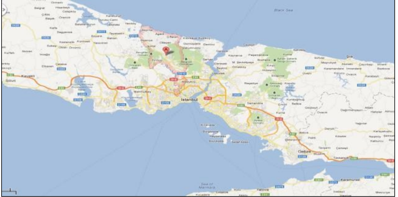
(İstanbul İl Haritası)